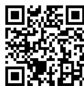
フリーランス保護法の概要