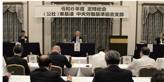
定時会員総会会場