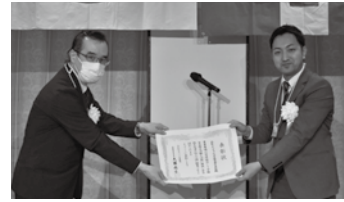
▲丸紅 ITソリューションズ株式会社様

表彰事由：丸紅 ITソリューションズ株式会社の本社事業場では、丸紅グループ労働安全衛生方針に基づき、経営トップの安全衛生方針の表明、管理体制の構築、法令の順守、教育を通じた安全衛生知識の醸成、リスクの低減と職場環境の継続的な改善、健康保持・増進の支援などの労働者の安全衛生管理を行っています。特に、安全管理の分野では、広い事務所を確保するとともに徹底的なペーパーレス化により余裕のあるオフィス空間を労働者に提供できていて、それが転倒をはじめとする行動災害防止の本質的安全対策となっていること。また、衛生管理の分野では、IT企業では、長時間労働が問題になりがちであるところ、管理ソフトを活用した時間外・休日労働時間等の「見える化」により適正把握をしていること、時間外労働の発生想定、顧客との調整、支援体制の構築により時間外・休日労働時間を削減していること、併せてフィジカル面及びメンタル面の健康管理を適切に行っていること。さらに、企業HPにおいて健康経営に関する「丸紅グループ健康宣言」、「健康経営戦略マップ」等を公表して、他企業の健康経営や意識向上にも寄与していること。これらの活動を労使協力して、活発に推進し、安全衛生水準を向上されていることは、特に同業他社の模範となると評価し、表彰することといたしました。