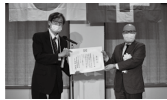
▲トモエ商事株式会社様

表彰事由：当該事業場は、安全衛生委員会が中心となり東京都皮革産業健康保険組合支援のもと、特に保健指導が必要な社員には速やかに指定病院での受診を実施するとともに、安パトについては、安衛委員と一緒に社内巡視を実施し、点検項目に対する判定の良否は、点数による見える化した記録簿を産業医と共有し、不良個所の改善に努めている。また、前記健康保険組合から配信される「HIKAKUけんこうタイムズ」も安全衛生教育の一環として取り入れるなど、積極的に安全衛生活動の取組を行っていることが評価されました。