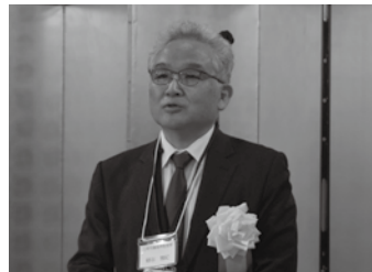
▲来賓ご紹介 細谷上野労働基準監督署副署長