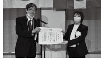
▲日本化学産業株式会社様

表彰事由：当該事業場の本社安全衛生委員会では、年間計画をもとに毎月の重点取組の課題と定例的な課題に分類し具体的な活動を実施している。特に重点取組のメンタルヘルス対策では、社内教育やセミナーなどを実施するとともに、12月の人権週間ではセクハラ・パワハラ対策を、また、定例的な取組では、熱中症予防やメタボ予防など食生活の改善なども産業医を中心にした保健指導を実施するなど、健康と安全に配慮した職場づくりに積極的に取り組んでいることが評価されました。