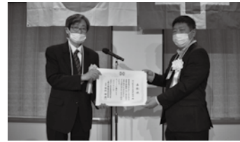
▲中川装身具工業株式会社様

表彰事由：当該事業場は、産業医と連携し年間テーマを定めた安全衛生委員会をコロナ禍でもほぼ毎月開催。特に社員等に関する健康診断について、健診結果を分析することにより健康改善にも役立っている。安全衛生活動については、職場の安パトや安全衛生教育の開催などを実施。また、製造業のため機械設備の定期点検の確実な履行を図ることにより人身事故の未然防止に寄与するなど、労使が一体となった取組が評価されました。