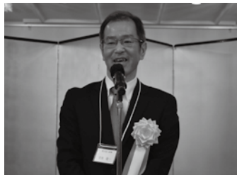
▲中締め 堂免副支部長