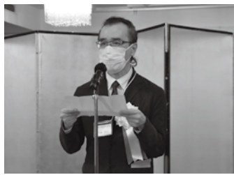
▲来賓祝辞 大國上野労働基準監督署長