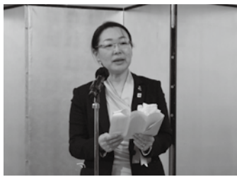
▲来賓祝辞 台東区長代理の上野産業振興担当部長