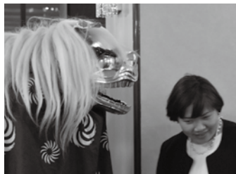
▲縁起のいい獅子に頭を噛まれる参加者